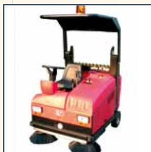
TETTUCCIO TECHO TOIT DE PROTECTION