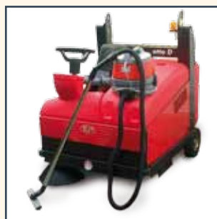
ASPIRAPOLVERE ASPIRADORA ASPIRATEUR