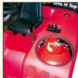
IMPIANTO GPL INSTALACIÓN LPG INSTALLATION GPL