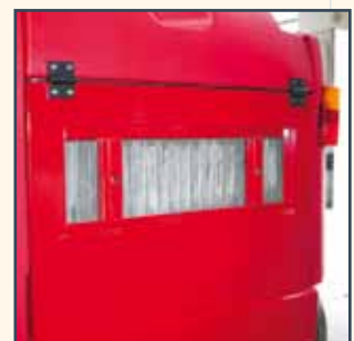
FILTRO A TASCHE FILTROS DE BOLSA FILTRES À POCHE